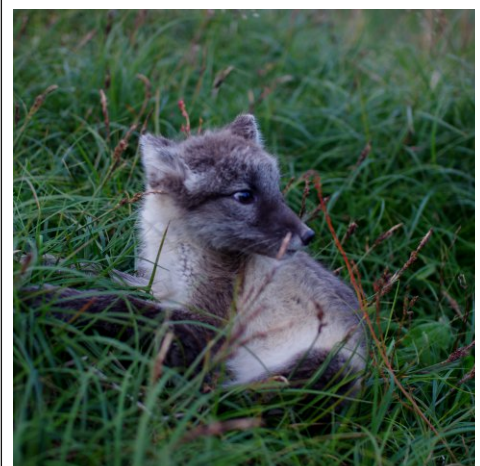
Nymärkt valp.