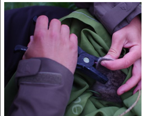
Rävarna märks i öronen med unika färgkombinationer.